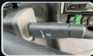
INTARDER 3, de 6 Tiempos