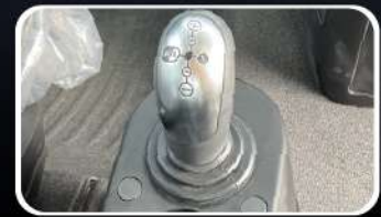
Caja ZF Automatizada 12 + 2

*La carrocería NO hace parte del producto publicitario.