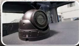
Kit Monitor de 4 Cámaras