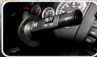
Retardador VOITH, de 5 Tiempos