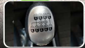
Transmisión 16 + 2