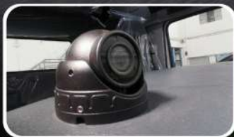
Kit Monitor de 4 Cámaras