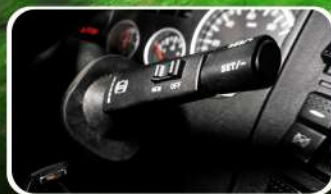
Retardador VOITH, de 5 Tiempos