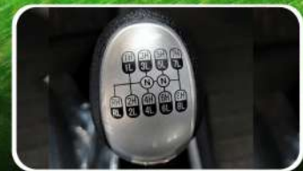
Transmisión 16 + 2